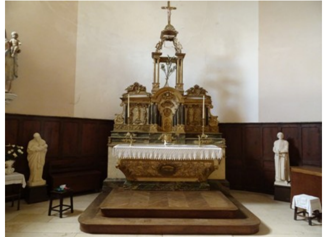
Autel de l'abside Ouest