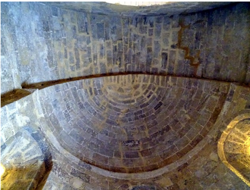
Voûte en pierre de l'abside romane